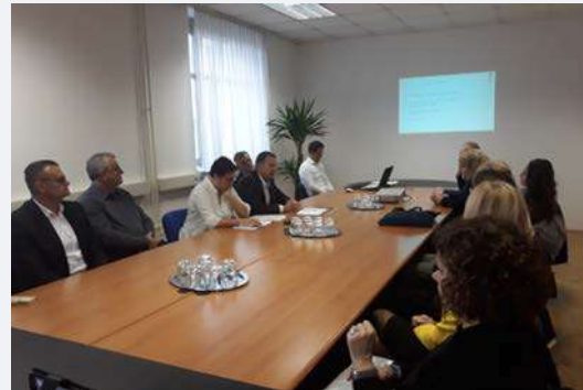
Studijska posjeta Specijalnom tužilaštvu Republike Slovenije, 21-23.10.2018.

Nakon održanih seminara, 10 predstavnika/ca sudova, tužilaštava i policije iz BiH, Crne Gore i Srbije su učestvovali na studijskoj posjeti Republici Hrvatskoj i