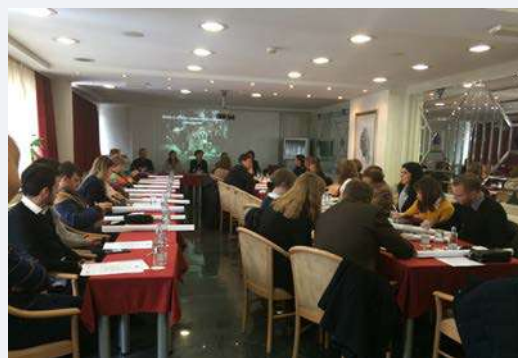
Okrugli sto Zločin iz mržnje i govor mržnje u BiH , održan u Sarajevu, 17.12.2018.