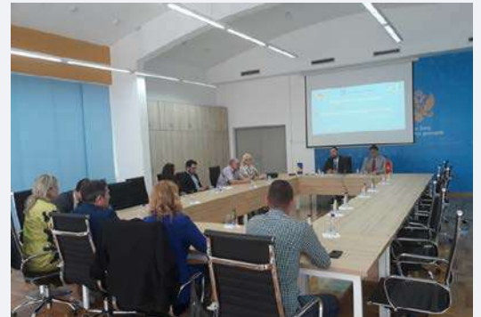
Studijska posjeta članova/ica Savjetodavnog odbora projekta institucijama Crne Gore, 24 – 27.04.2018.

U 2018. godini realizovane su sljedeće aktivnosti: