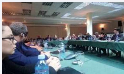
Sastanak Balkanske regionalne mreže za vladavinu prava (BRRLN), Ohrid, 13-15.04.2018.