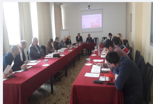
Okrugli sto Sarajevo, 20.02.2020. godine

Uzimajući u obzir probleme sa kojima se suočavaju mikro, mala i srednja preduzeća (MMSP) u BiH, Asocijacija za demokratske inicijative (ADI), uz suradnju sa Udruženjem poslodavaca Federacije Bosne i Hercegovine (UPFBiH) i Unije udruženja poslodavaca Republike Srpske (UUPRS), je u 2019. godini započela sprovođenje projekta pod nazivom “Unaprjeđenje pristupa privrednim sudovima u Bosni i Hercegovini, Izrada i distribucija Vodiča za samozastupanje za mikro, mala i srednja preduzeća (MMSP)”. Glavni cilj projekta je izrada i distribucija Vodiča za samozastupanje za MMSP u FBiH i