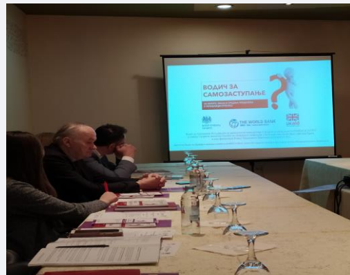
Okrugli sto Banja Luka, 24.02.2020.

U 2020. godini, ADI se fokusirala na distribuciju i promociju Vodiča za samozastupanje, te je izradila promotivne video spotove u svrhu promovisanja Vodiča za samozastupanje. Video spotovi su bili emitirani na TV stanicama u BiH, te su dostupni na Youtube kanalu ADI-a. 5 Svrha Vodiča za samozastupanje za mikro, mala i srednja preduzeća je da pomogne MMSP u Federaciji Bosne i Hercegovine i Republici Srpskoj da bolje razumiju sudske procese i steknu osnovna znanja neophodna kako bi se samozastupali na sudu. 6 Revizija Vodiča za samozastupanje je trenutno u toku.