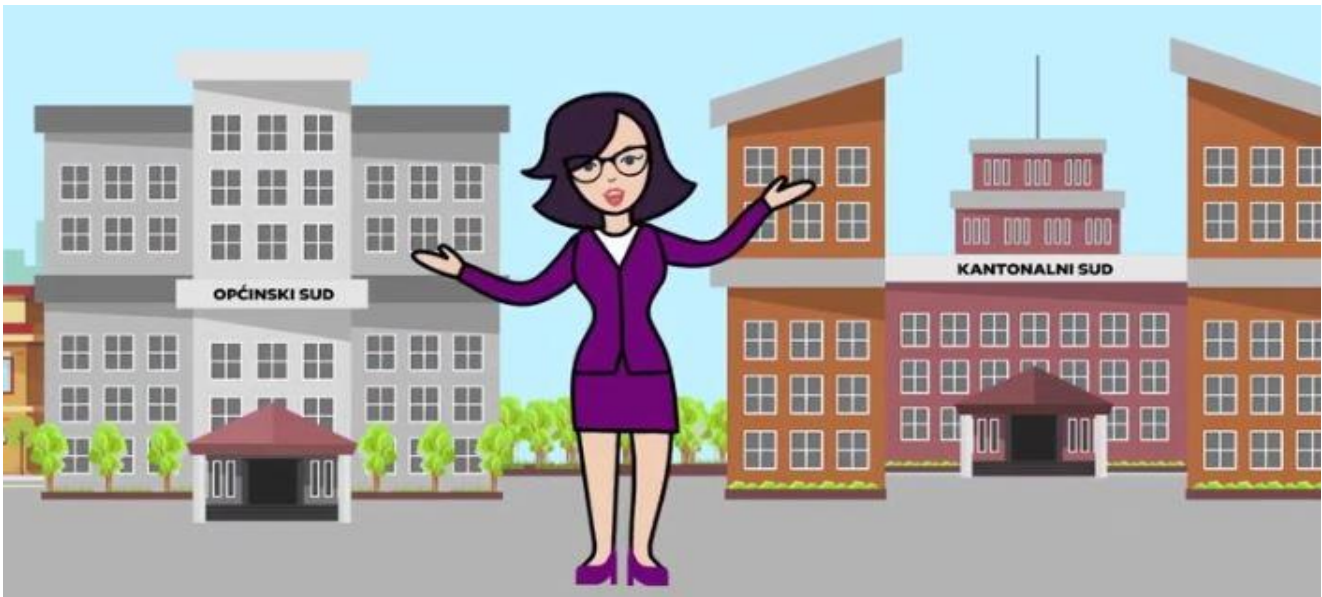
Isječak iz promotivnog video spota, Vodič za samozastupanje za MMSP